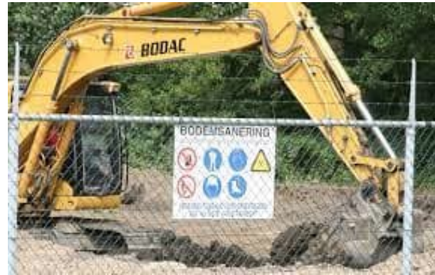
Saneren van de bodem