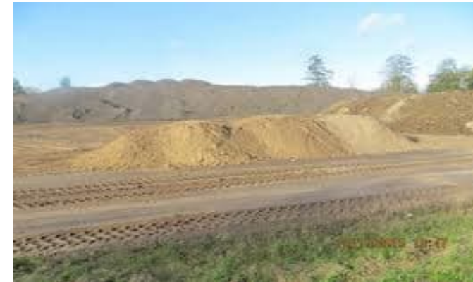
Opslaan van grond of baggerspecie