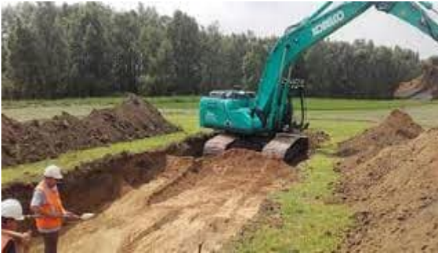
Graven in de bodem